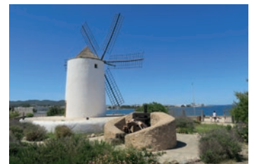
Espacio Cultural Sa Punta des Moli