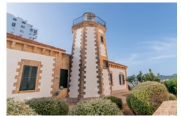
Faro de ses Coves Blanques

La tercera exposición viaja a Formentera. La isla se suma a CAN Art Fair en su segunda edición con la artista Ela Fidalgo (Palma de Mallorca, 1993) en colaboración con La Bibi Gallery. La tela, el hilo, la aguja y la pintura son las herramientas de trabajo de la creadora, cuyo discurso tiene como fin homenajear al cuerpo humano desvestido, imperfecto, diverso... a través de lienzos intervenidos y esculturas monumentales. La exposición tendrá lugar en el Blanco Hotel Formentera –del grupo Paya Hotels–, en Es Pujols, que se convierte así en un espacio cultural.