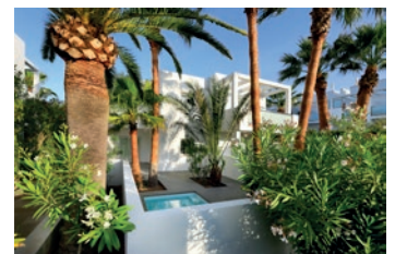
Blanco Hotel Formentera